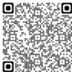
Figura I QR CODE_Whistleblowing: il sistema di segnalazioni interno - Gruppo Acea